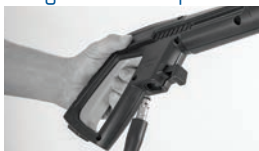
Montagem da mangueira na pistola