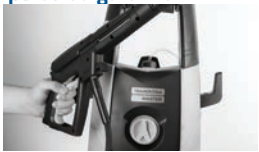
Remoção do ar (lavadora desligada)

ATENÇÃO: Trabalhar com ar no equipamento ou nas mangueiras pode ocasionar a queima do motor e implicará na perda da garantia.