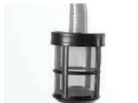
Filtro para sucção de água