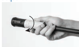
Regulagem da pressão