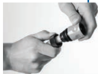
Montagem do engate rápido