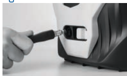
Montagem da mangueira na lavadora