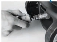
Fixação do engate rápido na lavadora