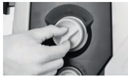
Acionamento da lavadora

Para mais informações consulte o manual de instruções.