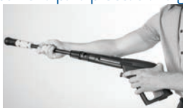
Montagem da ponteira