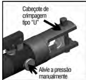
Fig.2 – Preparação

1 - Selecione a matriz apropriada de acordo com o tamanho do conector e do cabo que está sendo prensado. Caso o a bomba esteja com pressão, gire o parafuso de ajuste no sentido anti-horário para aliviar a pressão.