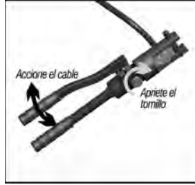
Fig.5 – Realizando el crimpado

4 - Apriete bien, girando en el sentido de las agujas del reloj, el tornillo de ajuste y accione la palanca hasta alcanzar la presión máxima y completar el crimpado del terminal en el cable.