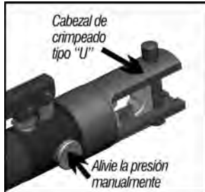
Fig.2 – Preparación

1-Seleccione la matriz apropiada de acuerdo con el tamaño del conector y del cable que está siendo prensado. Si la bomba está con presión, gire el tornillo de ajuste en el sentido contrario al de las agujas del reloj para aliviar la presión.