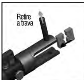
Fig.3 – Seleção da matriz

2 - Retire o pino trava e insira a matriz inferior no cabeçote.