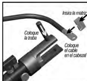
Fig.4 – Colocando el cable a ser prensado

3-Inserte en el cabezal el cable con el conector a ser prensado e inserte la matriz superior en el cabezal. Posicione correctamente el cable con el conector entre las dos partes de la matriz y coloque el perno traba para fijación de la matriz. Certifíquese de que las dos mitades de la matriz estén seguramente posicionadas y trabadas antes de operar la herramienta.