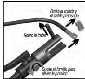
Fig.6 – Retirando el cable prensado

5 - Enseguida, suelte el tornillo de alivio girando en el sentido anti horario para aliviar la presión. Después de el pistón retraer, saque el perno traba, remueva la matriz superior y verifique si el prensado del terminal es apropiado.