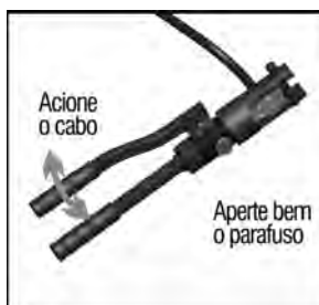
Fig.5 – Realizando a crimpagem

4 - Aperte bem, girando no sentido horário, o parafuso de ajuste e acione a alavanca até atingir a pressão máxima e completar a crimpagem do terminal no cabo.