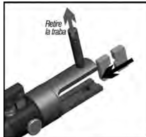
Fig.3 – Selección de la matriz

2-Retire el perno traba e inserte la matriz inferior en el cabezal.