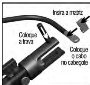
Fig.4 – Colocando o cabo a ser prensado

3 - Insira no cabeçote o cabo com o conector a ser prensado e insira a matriz superior no cabeçote. Posicione corretamente o cabo com o conector entre as duas partes da matriz e coloque o pino trava para fixação da matriz. Certifique-se de que as duas metades da matriz estejam seguramente posicionadas e travadas antes de operar a ferramenta.