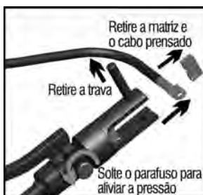
Fig.6 – Retirando cabo prensado

5 - Em seguida, solte o parafuso de alívio girando no sentido anti-horário para aliviar a pressão. Após o pistão retrainr, retire o pino trava, remova a matriz superior e verifique se a prensagem do terminal ficou apropriada.